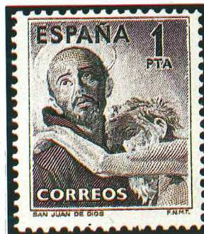
Este sello español de 1950 con un valor facial de 1 peseta y un valor actual de 150 francos franceses ha tenido una excelente revalorización.