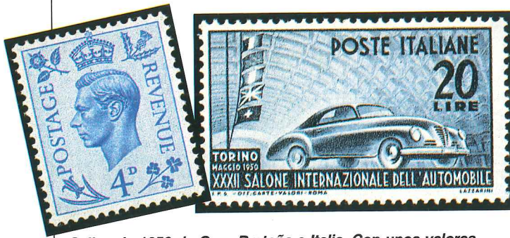
Sellos de 1950 de Gran Bretaña e Italia. Con unos valores faciales de 4 peniques y 20 liras, alcanzan hoy 20 y 50 francos franceses respectivamente. El hecho de ser conmemorativo y temático ha favorecido la revalorización del sello italiano.

motivos puede crear esta situación de escasez: un tema de interés mundial agota las existencias de países que hacen tiradas cortas, de acuerdo a sus necesidades. La escasez tiene entonces rápido eco en el mercado. También los acontecimientos filatélicos, como exposiciones, congresos, etc., son motivo de mayor demanda y normalmente se conmemoran con series especiales, de tiradas más limitadas que tienden a revalorizarse con mayor rapidez. En los primeros años del correo, las tiradas eran muy amplias, pero el tiempo transcurrido y el coleccionismo de ejemplares usados, dado su alto coste para la capacidad adquisitiva de la época, ha hecho que hayan llegado pocos sellos clásicos nuevos a nuestros días, y que su cotización acostumbre ser muy elevada.