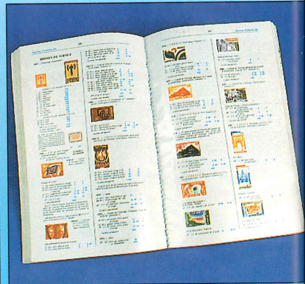
El catálogo Yvert et Tellier valora todos los sellos del mundo, siendo una útil guía de orientación de precios para comerciantes y coleccionistas.